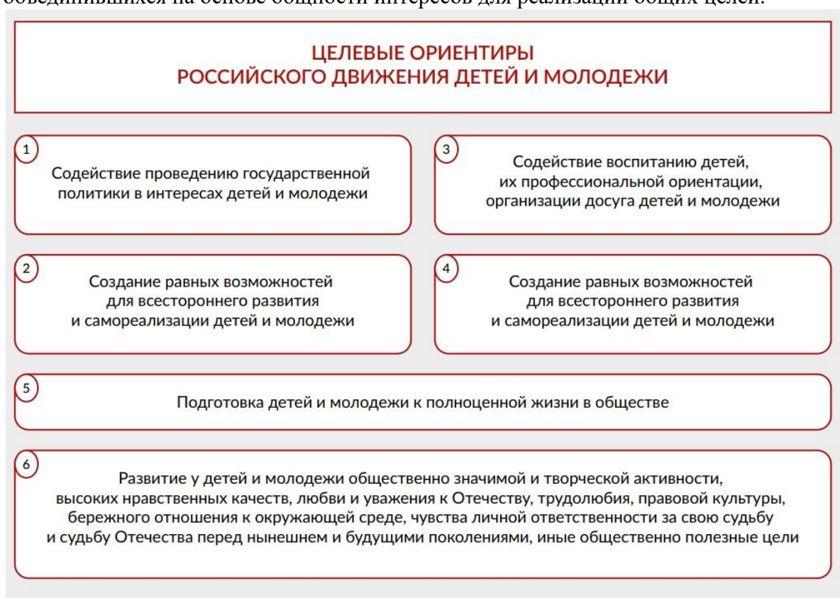
Рис. 2. Целевые ориентиры РДДМ (ФЗ № 261 от 14.07.2022: ст. 2, п.1)

В настоящее время история развития детских общественных объединений открывает свою новую главу. Сами участники детского движения выбрали название – «Движение Первых». Они же определяют основные направления и содержание деятельности Общероссийского общественно-государственного движения детей и молодежи, придумают игры, в которые будут играть, традиции, которые захотят соблюдать, свою систему личностного роста и самореализации, свои отличительные знаки, символы, ритуалы и вдохновляющие девизы – это добровольное детско-юношеское объединение обучающихся МБОУ «Рыбинская СОШ» с. Рыбного, созданное по инициативе детей и взрослых, объединившихся на основе общности интересов для реализации общих целей.