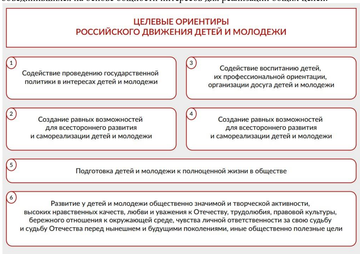
Рис. 2. Целевые ориентиры РДДМ (ФЗ № 261 от 14.07.2022: ст. 2, п.1)

В настоящее время история развития детских общественных объединений открывает свою новую главу. Сами участники детского движения выбрали название – «Движение Первых». Они же определяют основные направления и содержание деятельности Общероссийского общественно-государственного движения детей и молодежи, придумают игры, в которые будут играть, традиции, которые захотят соблюдать, свою систему личностного роста и самореализации, свои отличительные знаки, символы, ритуалы и вдохновляющие девизы– это добровольное детско-юношеское объединение обучающихся МБОУ «Рыбинская СОШ» с. Рыбного, созданное по инициативе детей и взрослых, объединившихся на основе общности интересов для реализации общих целей.