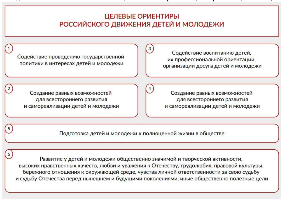
Рис. 2. Целевые ориентиры РДДМ (ФЗ № 261 от 14.07.2022: ст. 2, п.1)

объединившихся на основе общности интересов для реализации общих целей.