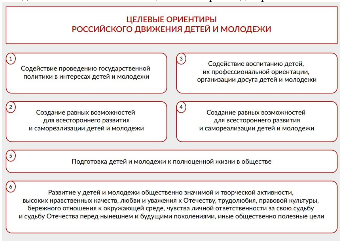
Рис. 2. Целевые ориентиры РДДМ (ФЗ № 261 от 14.07.2022: ст. 2, п.1)

В настоящее время история развития детских общественных объединений открывает свою новую главу. Сами участники детского движения выбрали название – «Движение Первых». Они же определяют основные направления и содержание деятельности Общероссийского общественно-государственного движения детей и молодежи, придумают игры, в которые будут играть, традиции, которые захотят соблюдать, свою систему личностного роста и самореализации, свои отличительные знаки, символы, ритуалы и вдохновляющие девизы– это добровольное детско-юношеское объединение обучающихся МБОУ «Рыбинская СОШ» с. Рыбного, созданное по инициативе детей и взрослых, объединившихся на основе общности интересов для реализации общих целей.